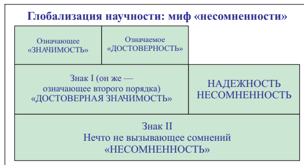
Рис. 2 | Схема образования мифа понятия «несомненности»

Подобным же образом может быть описана замена термина «значимость» на «достоверность».